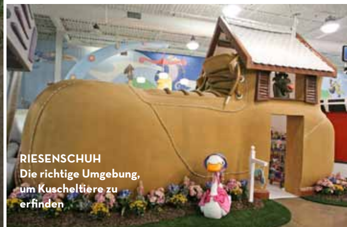
RIESENSCHUH Die richtige Umgebung, um Kuscheltiere zu erfinden