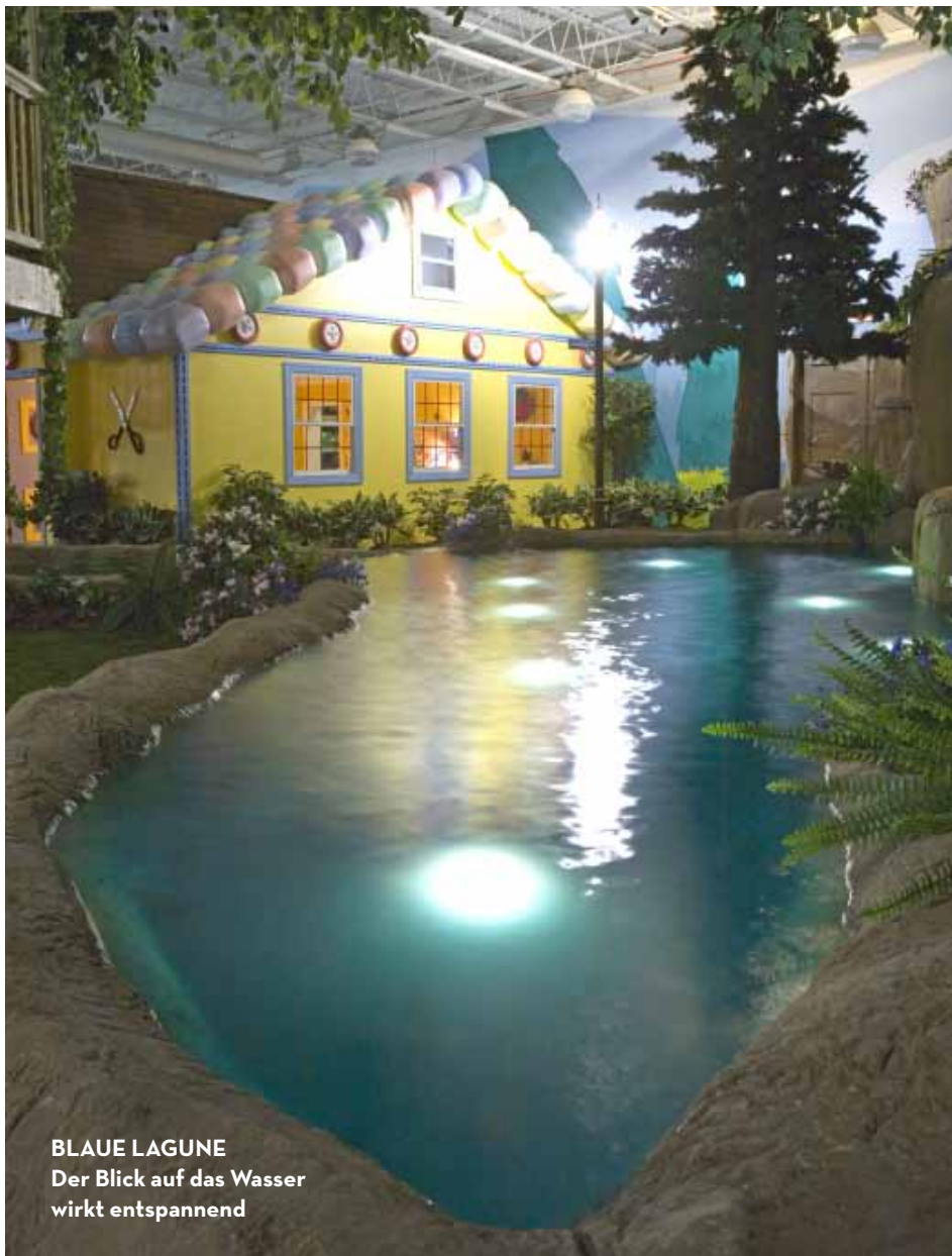
BLAUE LAGUNE Der Blick auf das Wasser wirkt entspannend

» Seitdem muss er sich weder um einen Bewerbermangel Sorgen machen, noch dass seine Mitarbeiter zu spät zur Arbeit kommen. Wo sonst darf man auf einem Piratenschiff eine Kanone zünden, um einen Geistesblitz zu feiern? Oder in einem Riesenschuh sich neue Kuschelpuppen ausdenken? Davisons Erfinder-Werkstatt wird inzwischen regelmäßig von großen Konzernen konsultiert, die nach neuen Ideen gieren. Und der Output der Kreativen ist gewaltig.